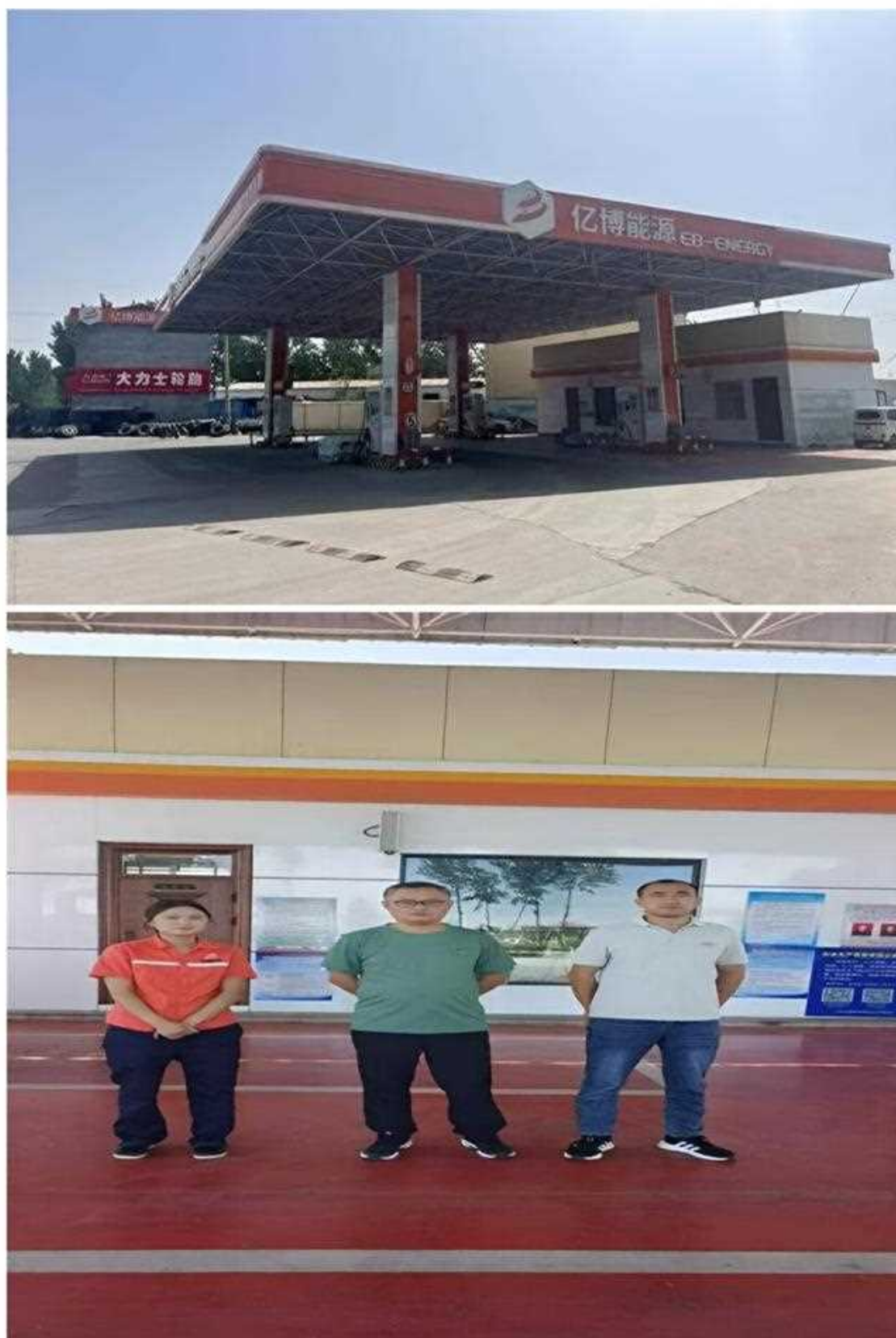
郟城双源油品有限公司现场照片