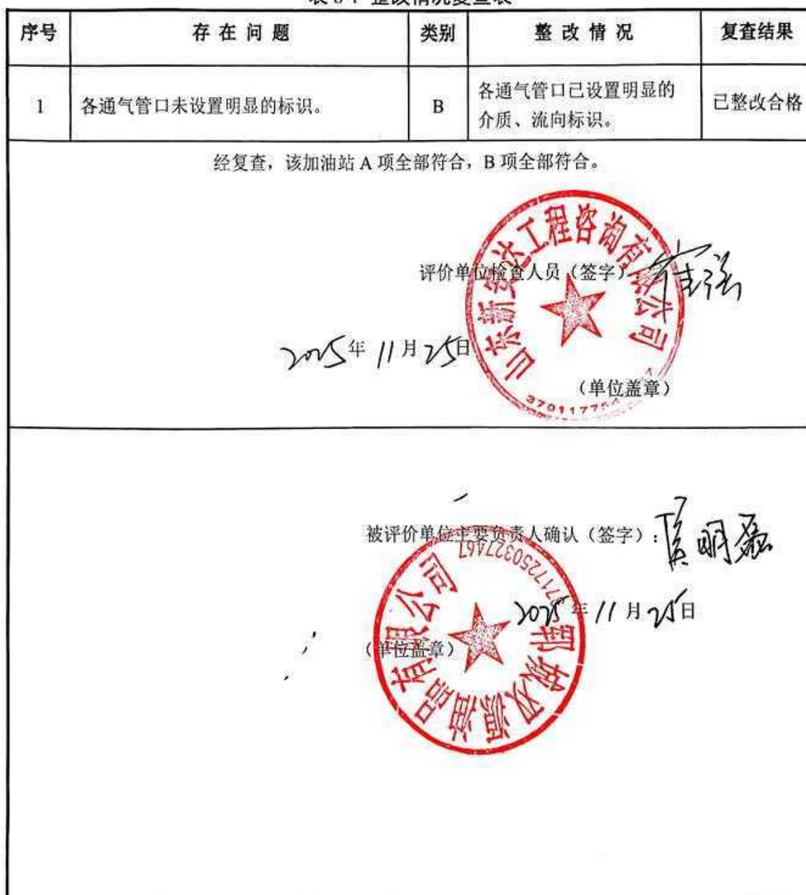
表 8-1 整改情况复查表